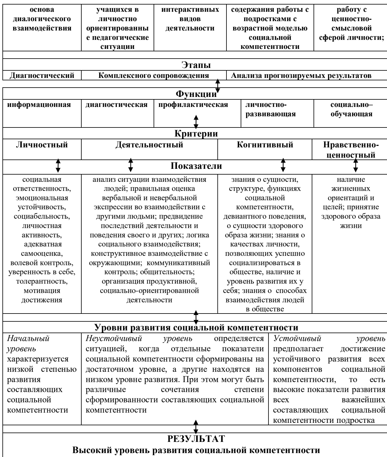
Приложение 2. Технологическая карта личностно ориентированных ситуаций развития социальной компетентности